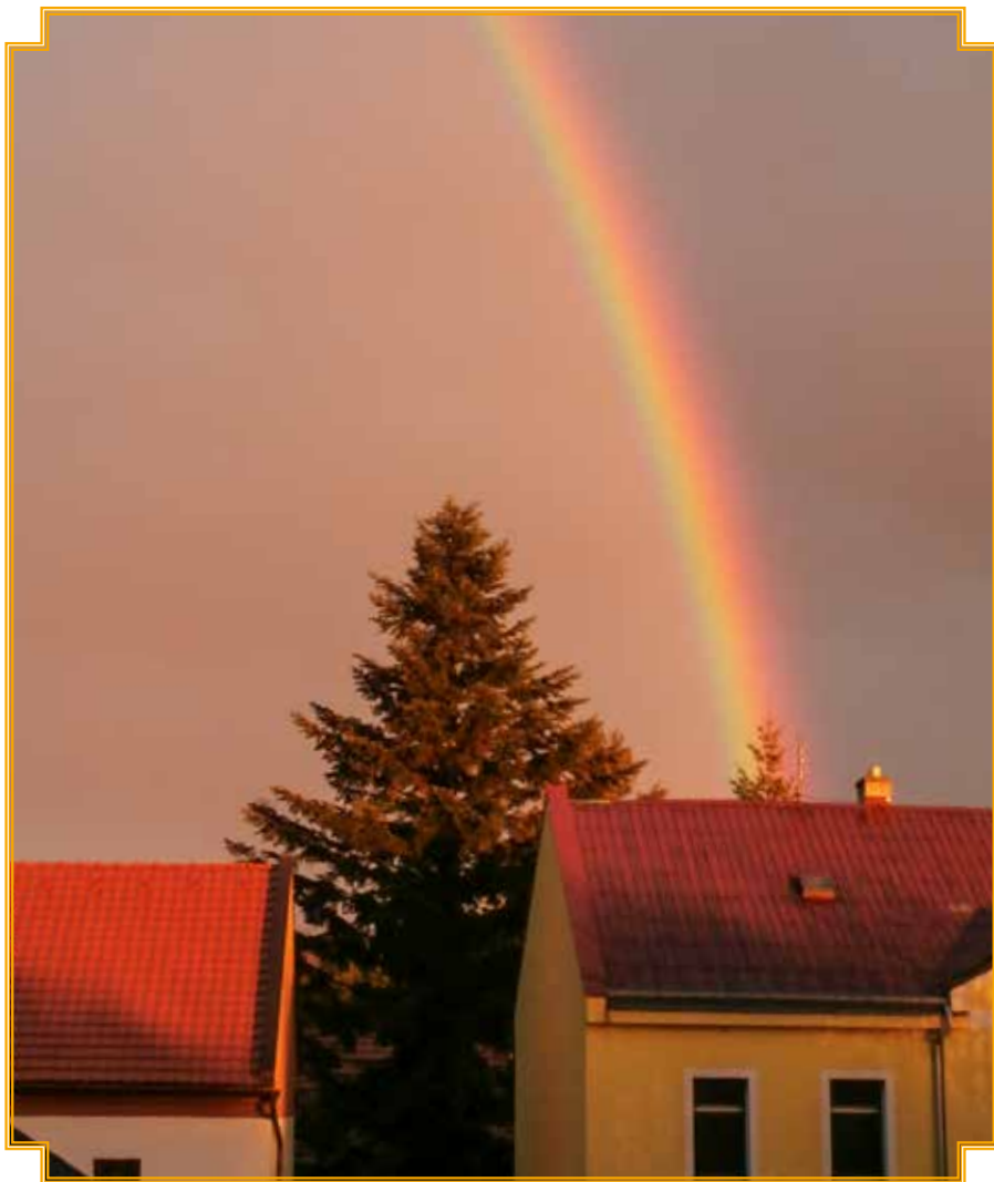
duha ve Velkém Újezdě